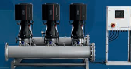
Surpresseur Hydro avec la nouvelle gamme CR pour les exploitants et armoire de commande DDD

Découvrez comment les Grundfos iSOLUTIONS peuvent optimiser votre réseau de distribution d'eau grâce au DDD et une connectivité intelligente sur grundfos.fr/waterdistribution