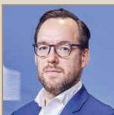
Commission EU Tim McPhee