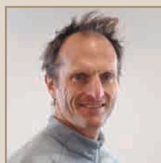
LEPMI - CNRS Marian Chatenet