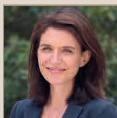
Pays-de-La-Loire Christelle Morançais