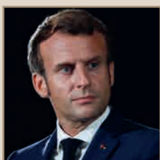
Elysée Emmanuel Macron